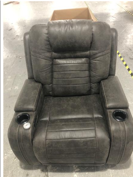
电动型多功能沙发